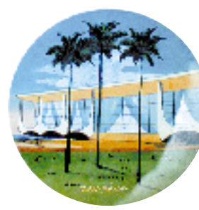
Prato de parede