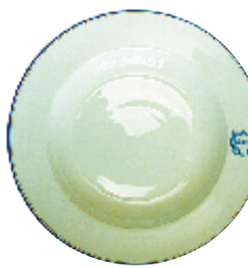
Prato com monograma de Cruls