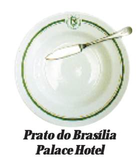
Prato do Brasília Palace Hotel