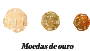
Moedas de ouro