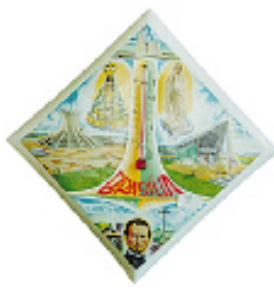
Termômetro de parede