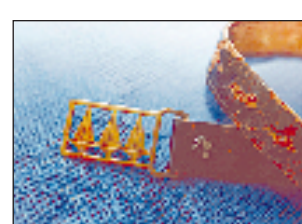
Cinto da inauguração