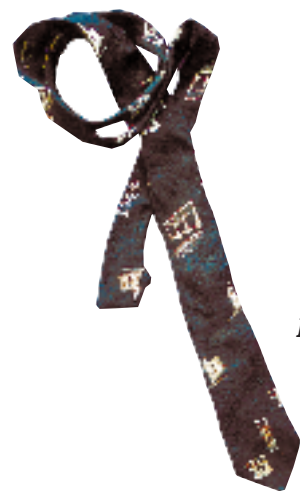
Gravata da inauguração